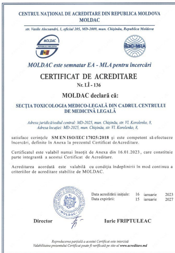
Figura 3.3. Certificatul de acreditare SM EN ISO/IEC 17025:2018