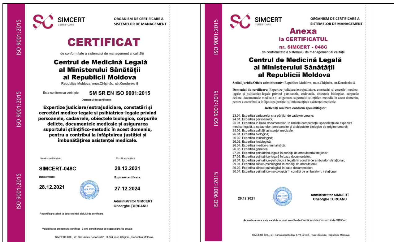
Figura 3.2. Certificatul de conformitate ISO 9001:2015